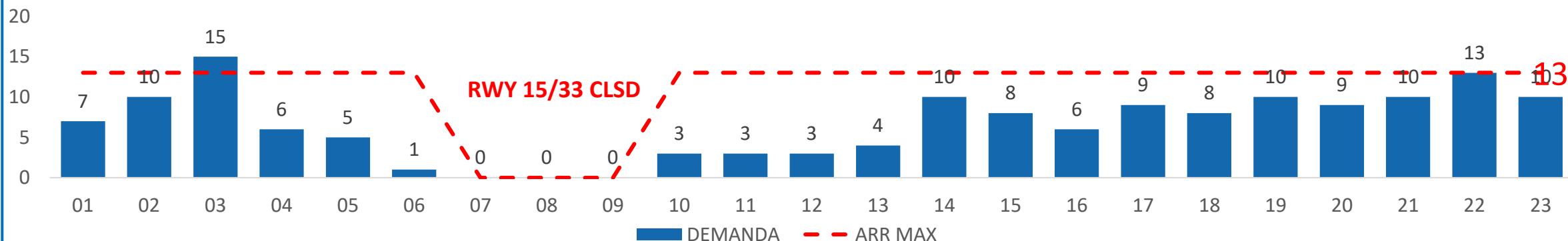
Gráfico de Demanda: 170322 00:00 /170322 23:59 UTC Av. Com. Reg. ARR RWY 15 - SPJC

SPJC 162310Z 1700/1724 19009KT CAVOK TX26/1719Z TN19/1711Z FM170700 22005KT 8000 SCT005 TEMPO 1711/1712 4900 BR OVC005 FM171500 20004KT CAVOK BECMG 1719/1721 18010KT=