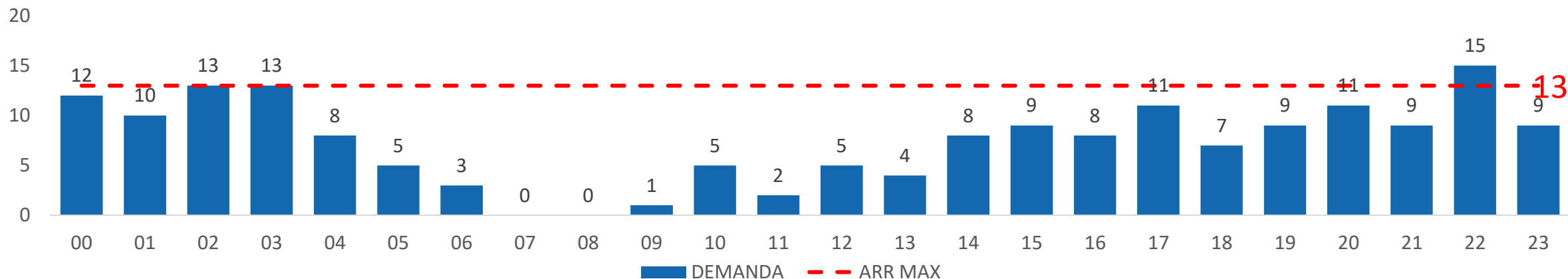
Gráfico de Demanda: 030122 00:00 /030122 23:59 UTC Av. Com. Reg. ARR RWY 15 - SPJC

SPJC 022310Z 0300/0324 17008KT 9999 SCT010 TX24/0319Z TN20/0311Z BECMG 0308/0310 BKN012 BECMG 0314/0316 SCT012 BECMG 0317/0319 19011KT=