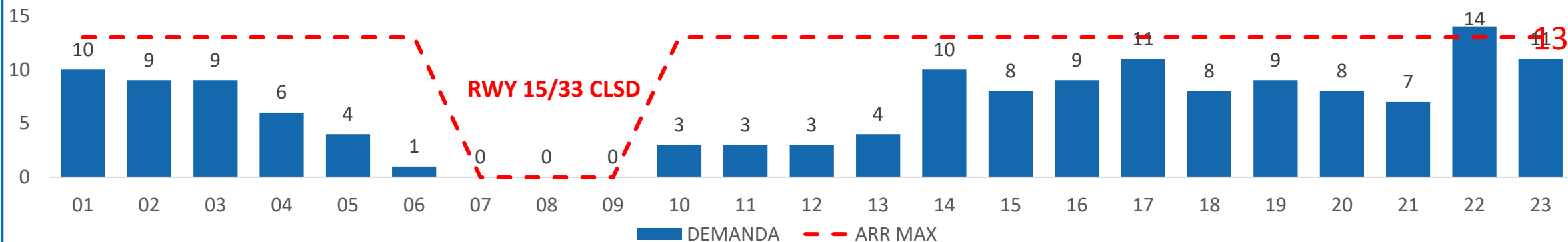
Gráfico de Demanda: 010422 00:00 /010422 23:59 UTC Av. Com. Reg. ARR RWY 16 - SPJC

SPJC 012310Z 2900/2924 18010KT CAVOK TX24/2919Z TN17/2911Z BECMG 2903/2905 18008KT CAVOK BECMG 2919/2921 19015KT= =Updated TAF Click here